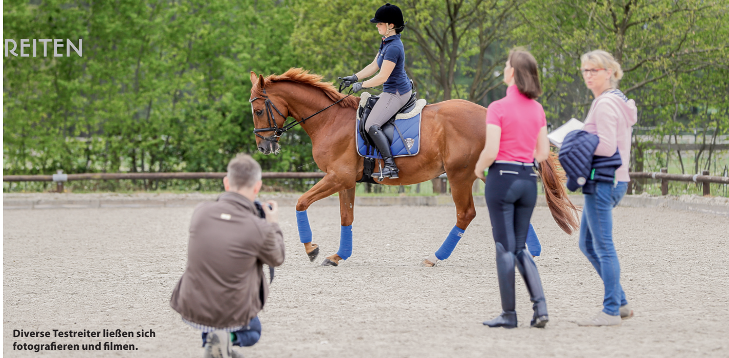
Diverse Testreiter ließen sich fotografieren und filmen.

E s führt kein Weg daran vorbei: der Prozess des Reitens dauert einfach seine Zeit und hört auch nie auf. So wie ein Pferd anhand der Skala der Ausbildung Schritt für Schritt an immer komplexere Aufgabenstellungen herangeführt wird, muss auch der lernende Reiter anhand einer Skala der Reiter-Ausbildung langsam und stetig einen Schritt nach dem nächsten tun. Manch einer braucht vielleicht aufgrund seines Bewegungsgefühls nur einige wenige Reitstunden, bis er sein Gleichgewicht auf dem Pferd gefunden hat und eine der wichtigsten Forderungen erfüllt: nämlich unabhängig von der Hand zu sitzen. Andere dagegen brauchen dafür Jahre und wei-